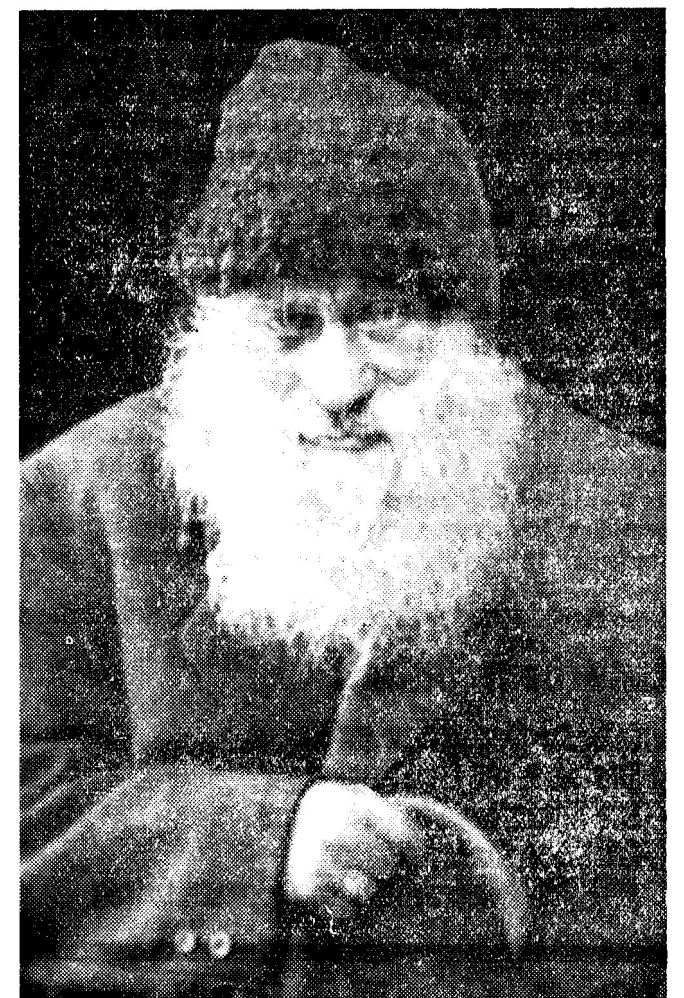
Ein polnischer Jude