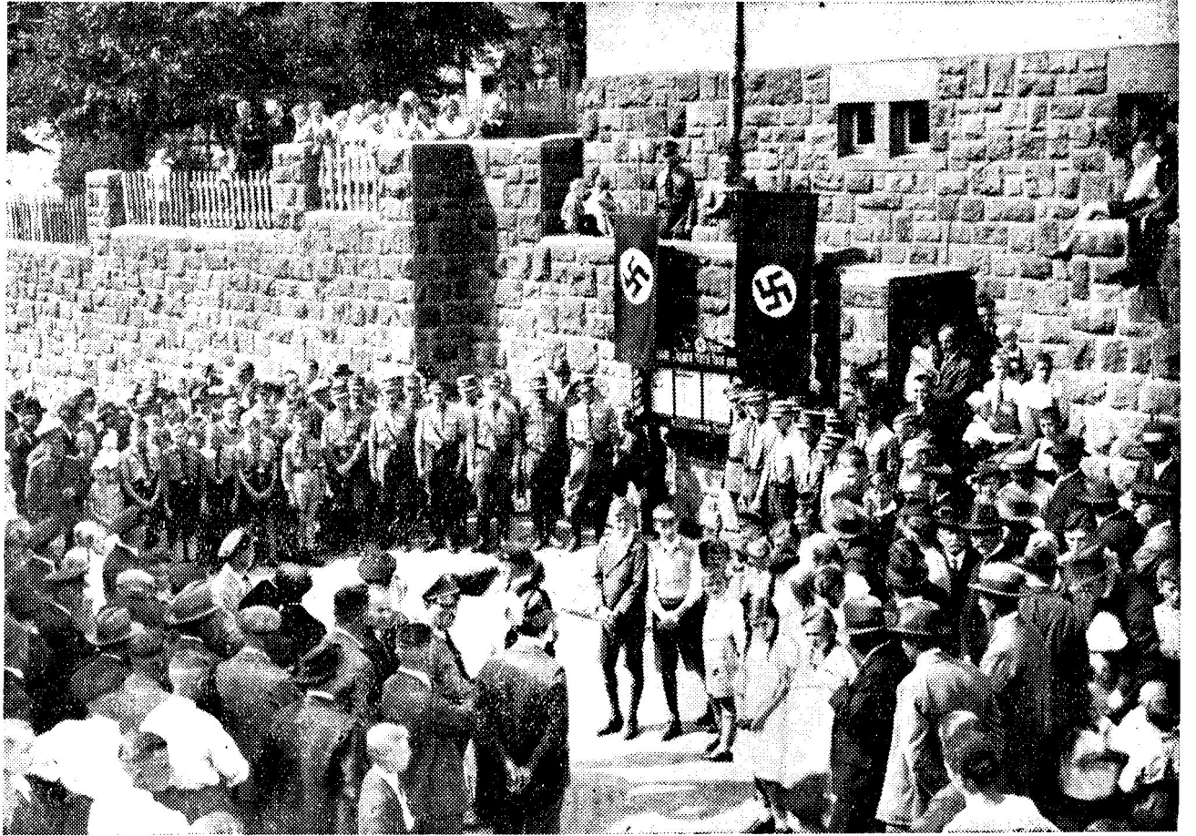
Einweihung des Stürmerkastens in Isdorf-Mücke