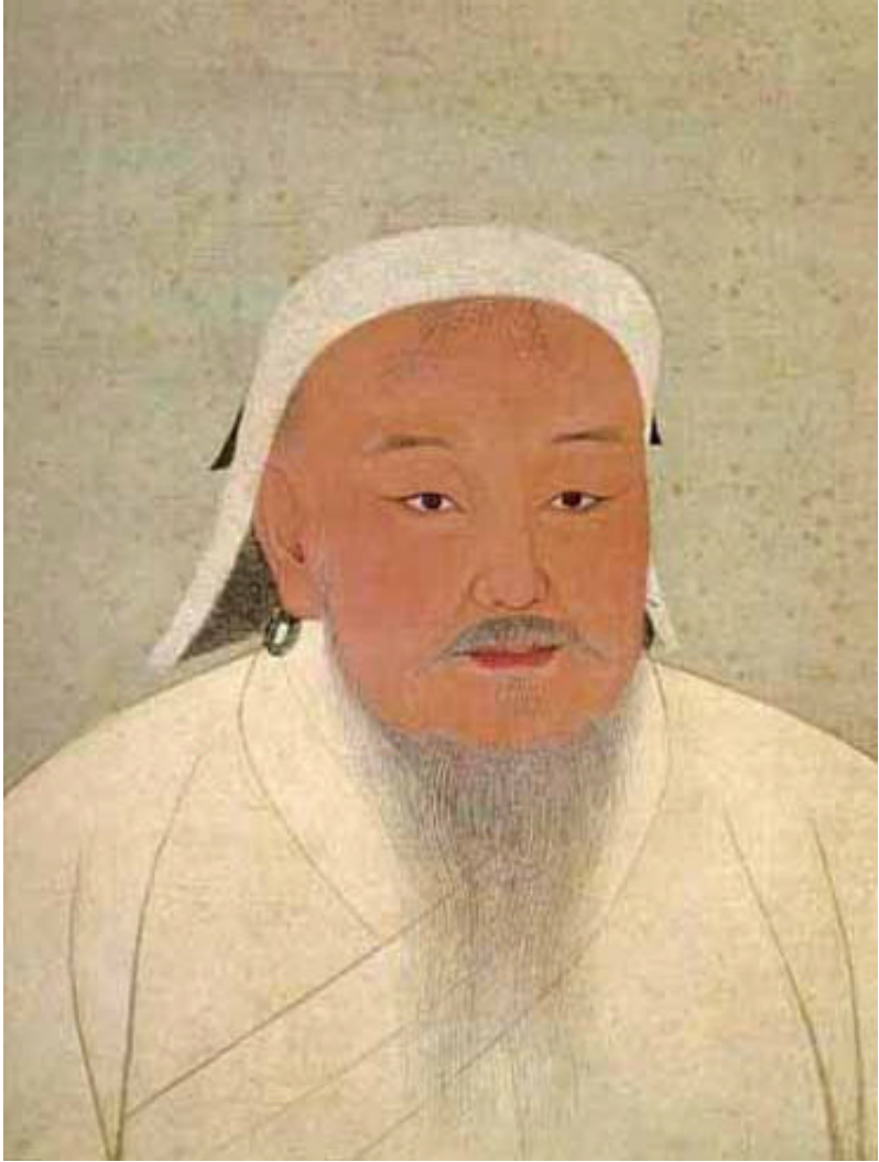
Genghis Khan Palace Museum Taipei - Taiwan