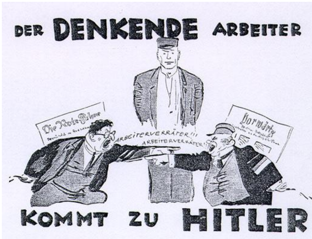
Imagem: “O trabalhador consciente vai para Hitler”, diz a legenda. Um comunista e um socialista estão acusando-se mutuamente de trair a classe trabalhadora.

Uma vez que os poderes políticos atuais não estão nem dispostos nem capazes de criar tal situação, o socialismo deve ser defendido. É um grito de guerra tanto interno quanto externo. Destina-se internamente nos partidos burgueses e marxismo, ao mesmo tempo, porque ambos são inimigos do estado nos próximos operário jurado. É dirigida ao exterior em todos os poderes que ameaçam a nossa existência nacional e, assim, a possibilidade de o Estado nacional socialista que vem.