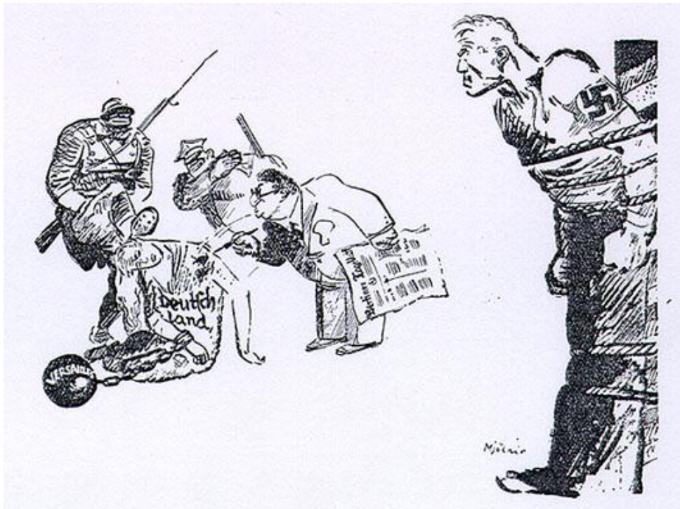
Imagem: um nazista amarrado assiste enquanto um judeu segura o Berliner Tageblatt, que os nazistas acusaram de ser um jornal judaico, maltratam a Alemanha acorrentada ao Tratado de Versalhes. O judeu, provavelmente, é supostamente o jornalista, já que está borrando a Alemanha com sua caneta. Um soldado negro colonial francês e um policial ajudam. O policial é provavelmente polonês (uma vez que a Alemanha perdeu território para a Polônia, como resultado do Tratado de Versalhes).

É assim que as coisas são hoje na Alemanha. O nacionalismo se transformou em patriotismo burguês e seus defensores estão combatendo moinhos de vento. Um fala de Alemanha e quer dizer monarquia. Outro proclama liberdade e quer dizer Preto-Branco-Vermelho (as cores da bandeira alemã). Será que a nossa situação hoje seria diferente se nós substituíssemos a república com uma monarquia e erguessemos a bandeira preta, branca e vermelha? A colônia teria um papel de parede diferente, mas a sua natureza, seu conteúdo, permaneceria a mesma. Na verdade, as coisas seriam ainda piores, porque uma fachada que esconde os fatos dissipa as forças hoje travadas contra a escravidão.